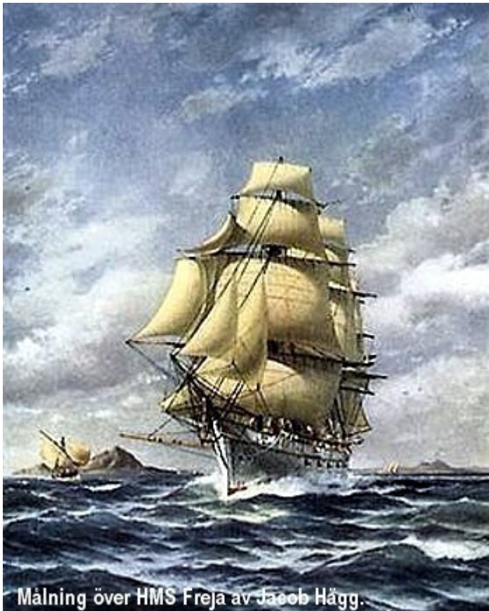
Målning över HMS Freja av Jacob Hägg.