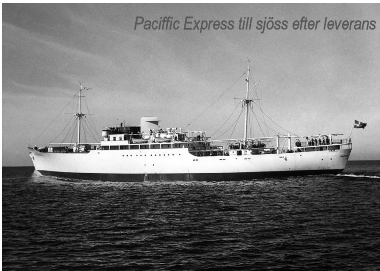
Pacific Express till sjöss efter leverans.