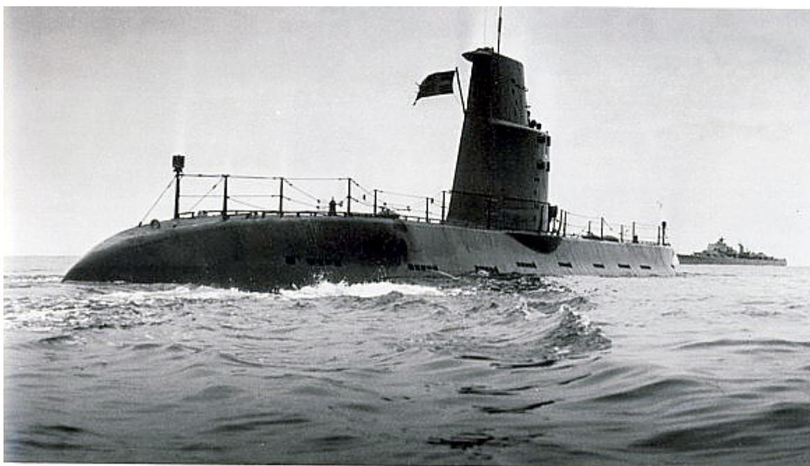
Illern stävar fram i betydligt makligare takt.