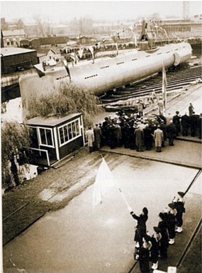
Honnörsstyrka från Öresunds Sjövärnskår vid HMS Bäverns sjösättning vid Kockums den 3 februari 1958

Honnörsstyrka från Öresunds Sjövärnskår vid HMS Bäverns sjösättning vid Kockums den 3 februari 1958.