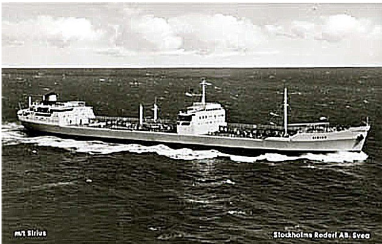
M/T Sirius. Stockholms Rederi AB Svea