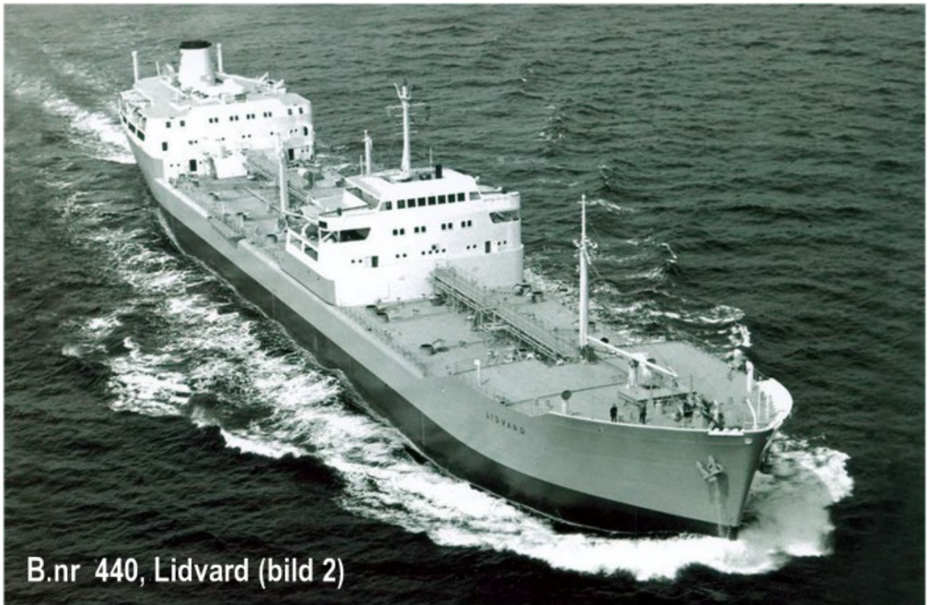
B.nr 440, Lidvard (bild 2)

Dette bildet er sannsynlig fra prøveturen 1959, nypusset og fin skute.