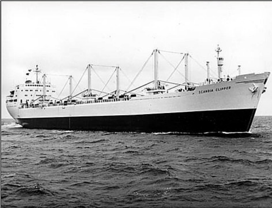
B.nr 481 Scandia Clipper – provtur 17 augusti 1961

B.nr 481 Scandia Clipper – provtur 17 augusti 1961.