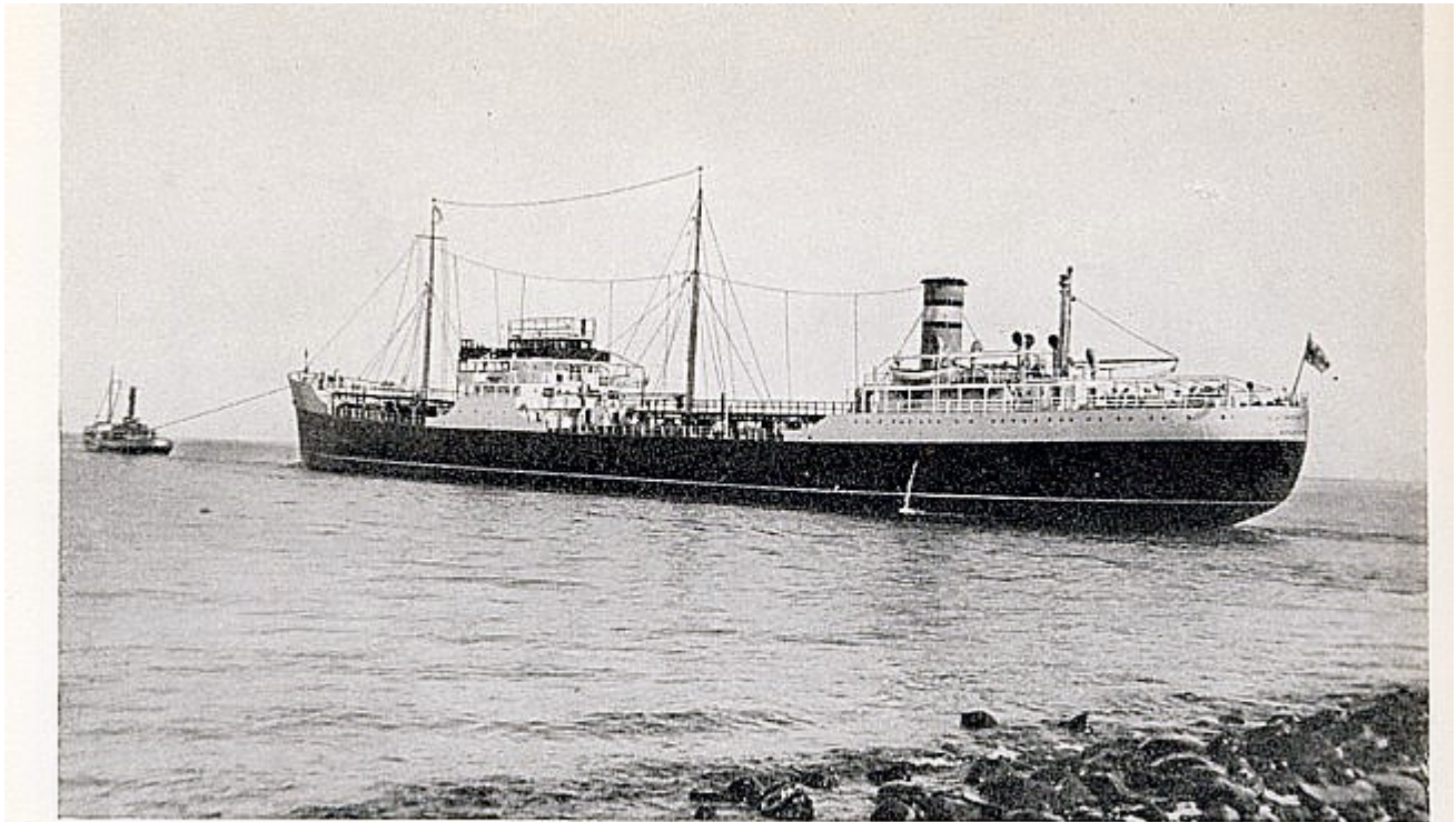
Tankmotorfartyget O. B. Sørensen.