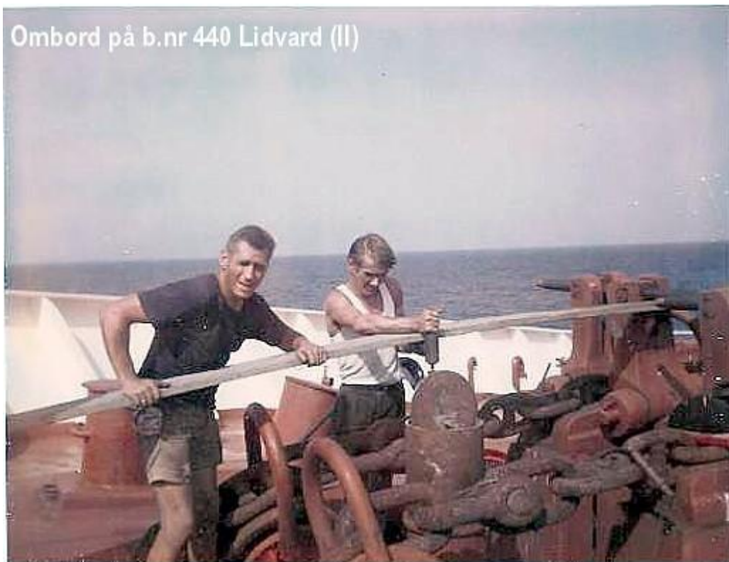
Ombord på b.nr 440 Lidvard (II)

Var Motormann ombord her fra høst 1967 – høst 1969 Fin båt . Kocums Man har jeg skrudd en del på , fin motor.