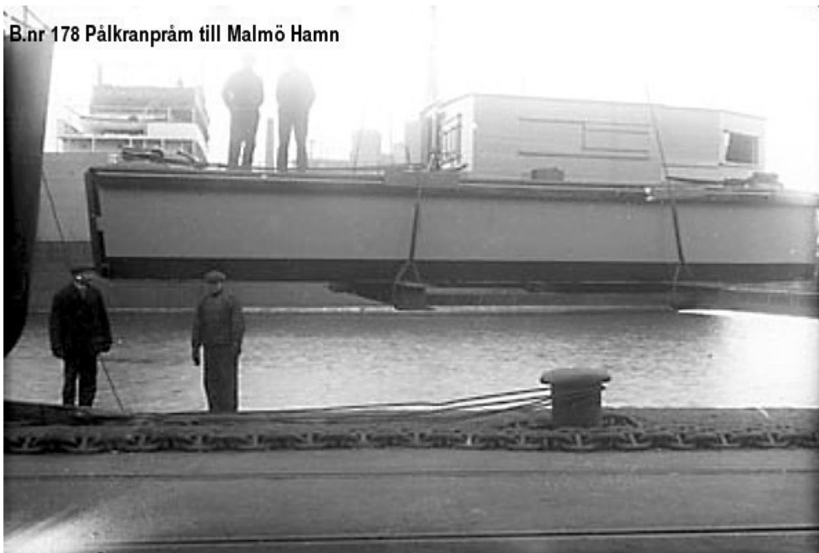
Pålkranpråm till Malmö Hamn.