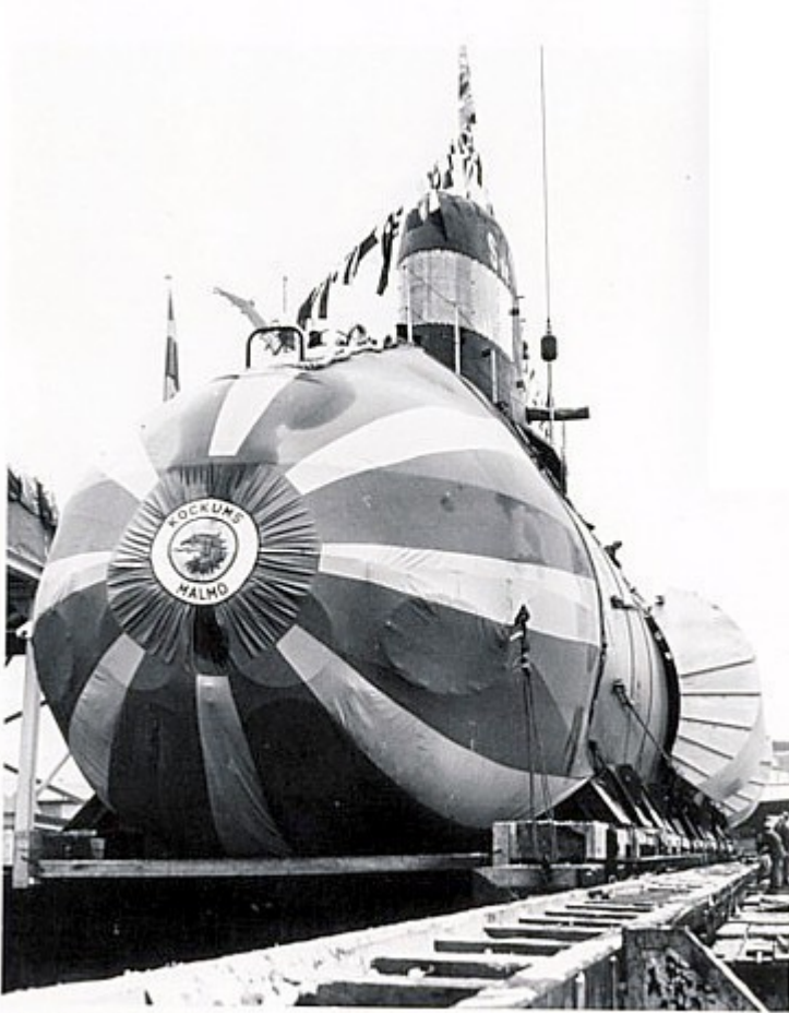
Sjöormen före sjösättning är en imponerande syn. Fören täcktes dels av estetiska skäl, dels för att dölja antal och placering av torpedtuber. Som synes var det senare ett hopplöst företag.