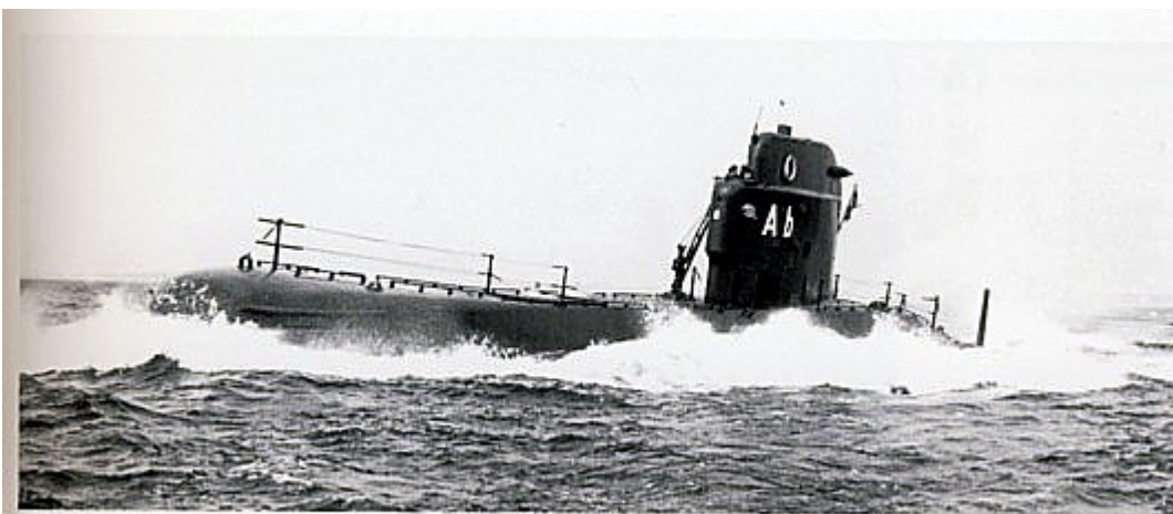
Vad gör man inte för en bra bild?