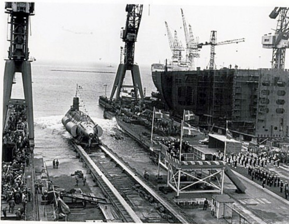
Sjösättning! Sjölejonet på väg ut under kranarna. Skådespelet utspelar sig den 29:e juni 1967.