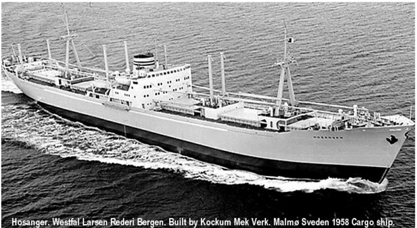
Hosanger. Westfal Larsen Rederi Bergen. Built by Kockum Mek Verk. Malmö Sveden 1958 Cargo ship.