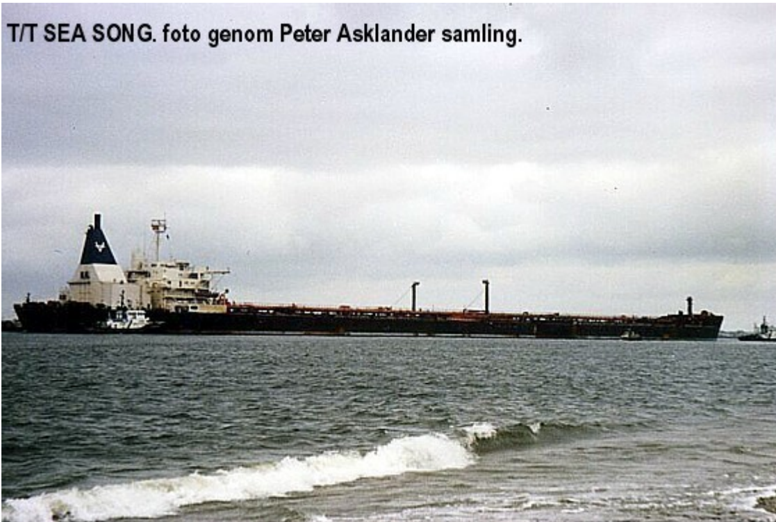
T/T Sea Song.