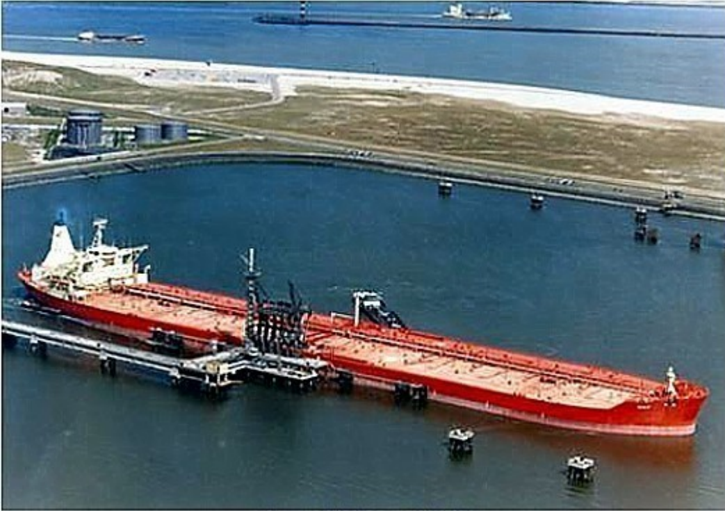
"Vanja" at Europort, Rotterdam.

Vanja at Europort, Rotterdam