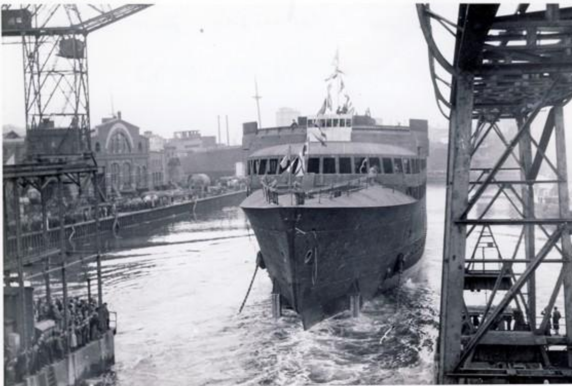
B.nr 219 Tågfärjan Malmöhus Sjösättning från bädd 2 den 10.10 1943