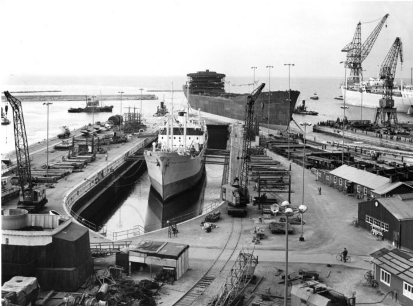
Varvsbild från 1957: Docka 3 med reparenten Tilia Gorthon. Sjösättning av tankfartuget Butmah, Bnr 390.