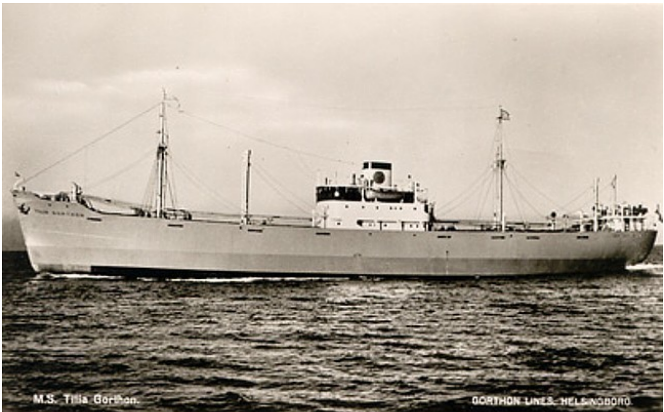
M.S. Tilia Gorthon. Gorthon Lines, Helsingborg.