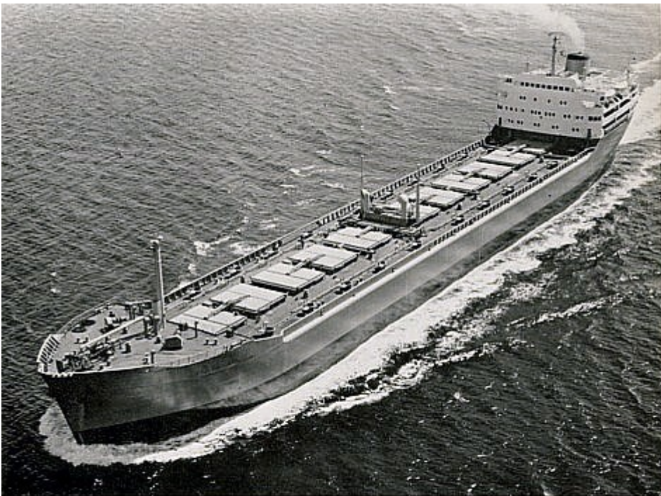
Virtala , motor ore and oil carrier, 21,900 tons d.w., 7,200 b.h.p., 14.5 knots, built for Trafikaktiebolaget Grängesberg—Oxelösund, Stockholm.

Virtala, motor ore and oil carrier, 21,900 tons d.w., 7,200 b.h.p., 14.5 knots, built for Trafikaktiebolaget Grängesberg – Oxelösund, Stockholm.