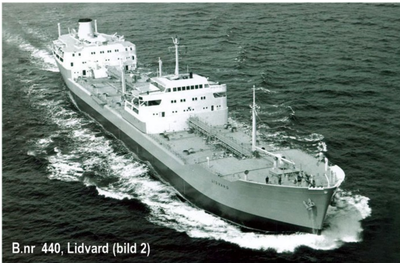
B.nr 440, Lidvard (bild 2)

Dette bildet er sannsynlig fra prøveturen 1959, nypusset og fin skute.