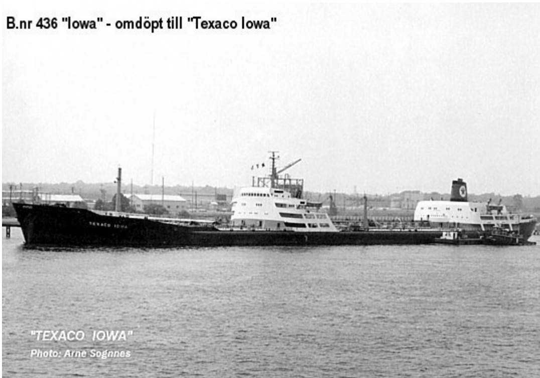
B.nr 436 "Iowa" - omdöpt till "Texaco Iowa"

B.nr 436 Iowa omdöpt till Texaco Iowa . Texaco Iowa.