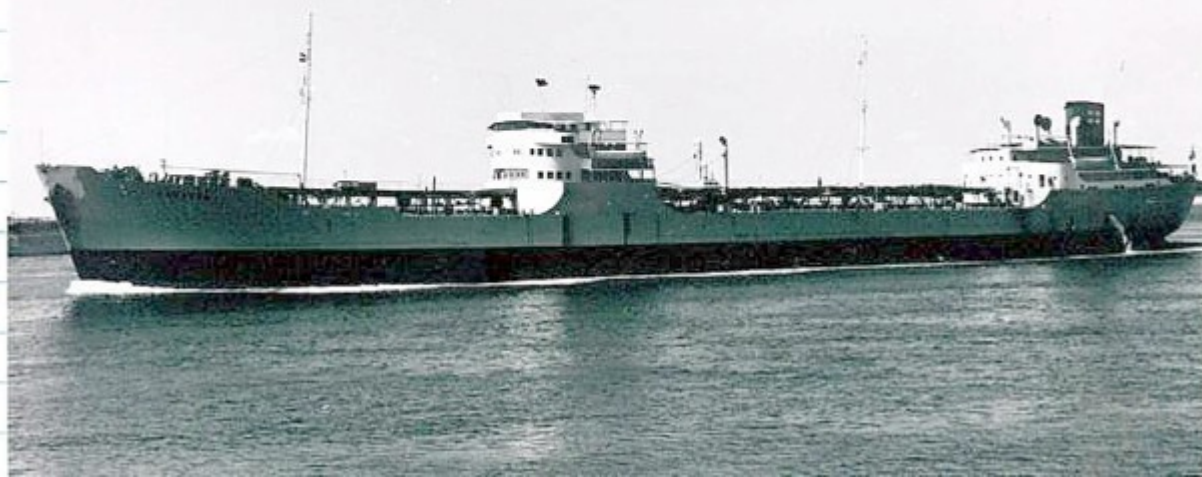
B.nr 306 "Kongsgaard" - (här omdöpt till "Marimunda")

B.nr 306 Kongsgaard (här omdöpt till Marimunda ).