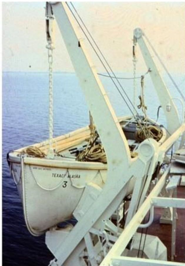
Foto Bo Nilsson som var med på en endagarsprovttur i Sundet före leverans