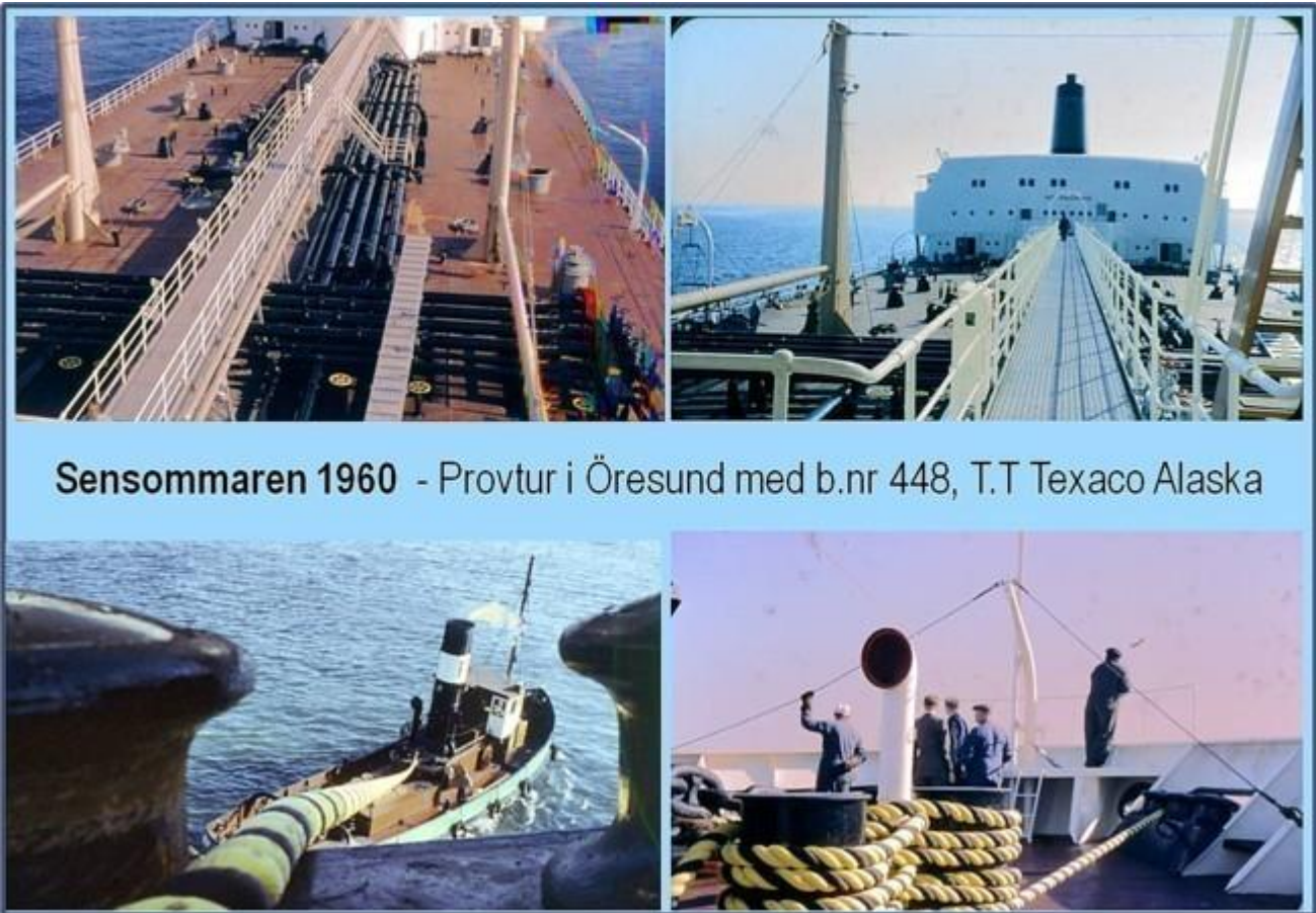
Sensommaren 1960 - Provtur i Öresund med b.nr 448, T.T Texaco Alaska

Foto Bo Nilsson som var med på en endagarsprovtur i Sundet före leverans.