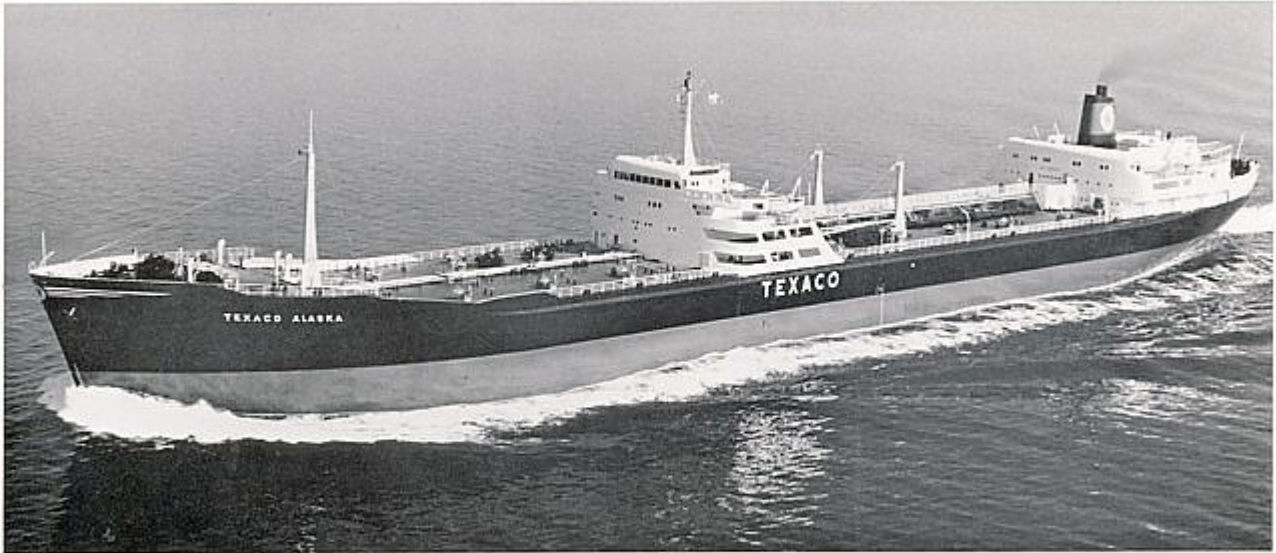
S.T. TEXACO ALASKA, turbine tank ship 41,050 tons d.w., 17 1/4 knots.