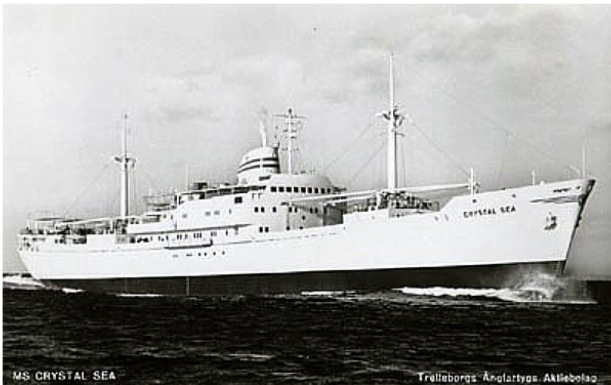
MS Chrystal Sea. Trelleborgs Ångfartygs Aktiebolag.