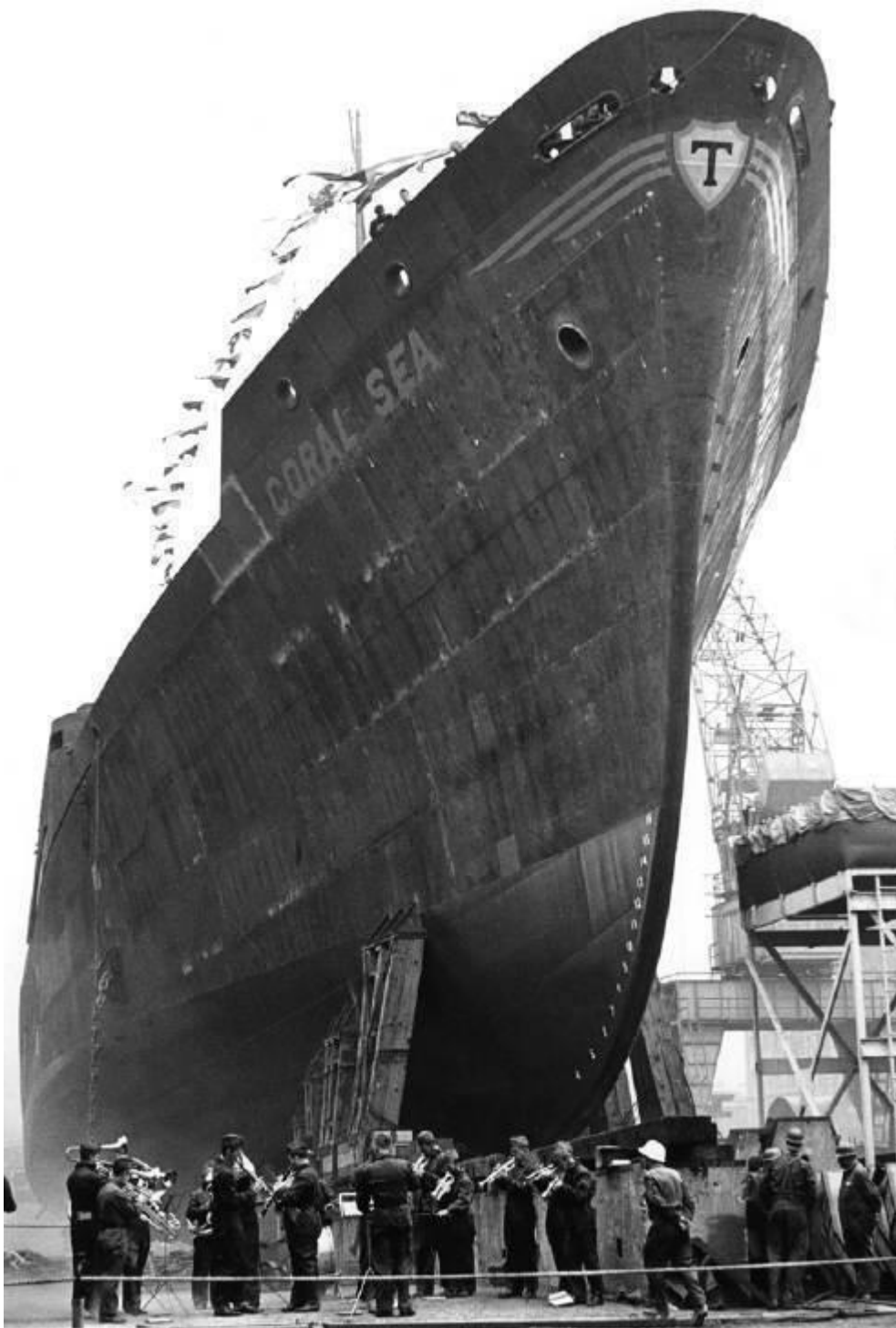
Kylfartyget Coral Sea, bnr 465 levererad 1960.