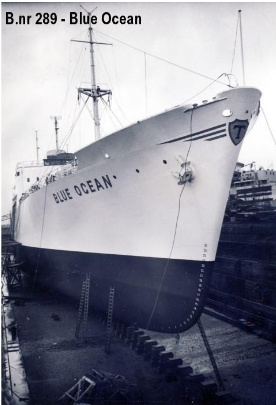
B.nr 289 - Blue Ocean