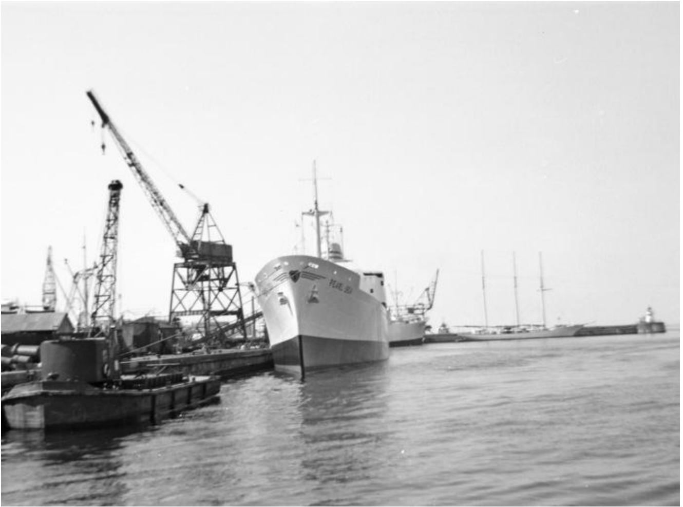
Tankfartyget M/T Nyköpinghus (nr 388, 1955)