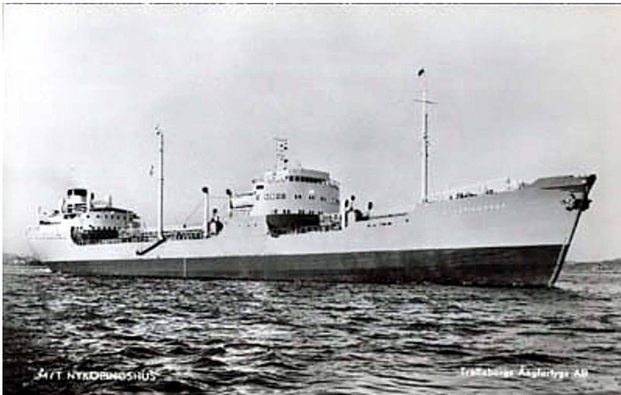
M/T Nyköpingshus, Trelleborgs Ångfartygs AB