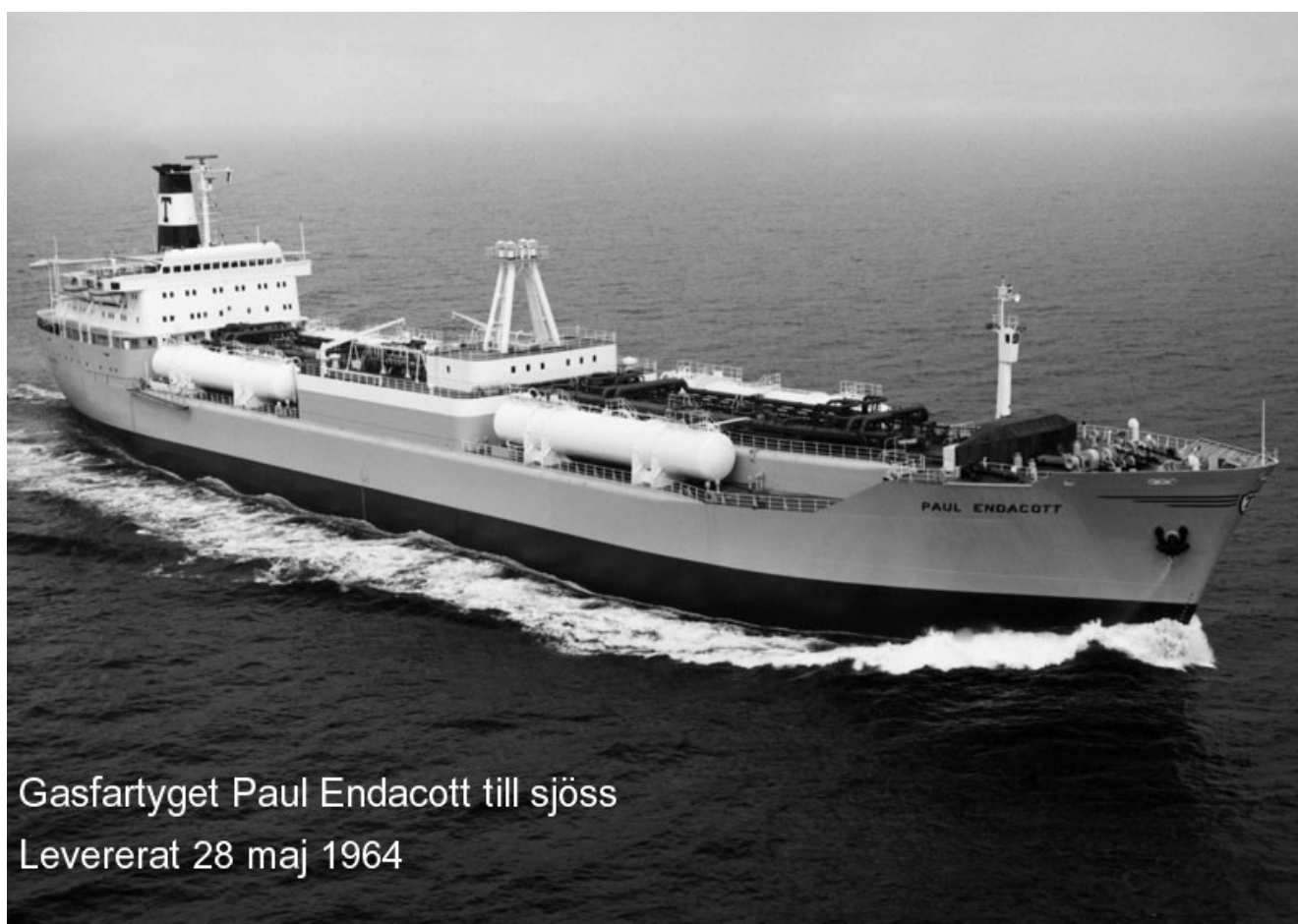
Gasfartyget Paul Endacott till sjöss Levererat 28 maj 1964

Gasfartyget Paul Endacott till sjöss. Levererat 28 maj 1964.